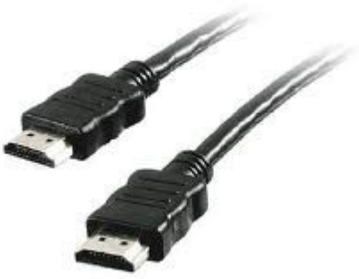
Câble HDMI .