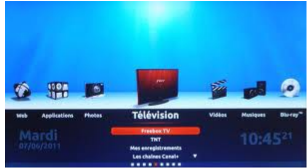
Menu Freebox (Photos, Télévision, Vidéos etc..).

(ce menu est le nouveau, je ne crois pas que tu ai le même).